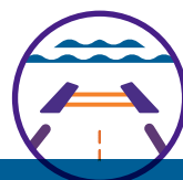
海上、铁路和公路运输公司